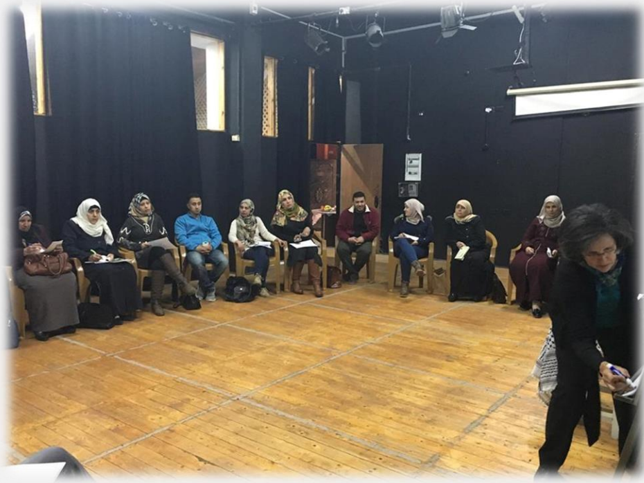
ورشة عمل منطقة الشمال

وخلال ورش العمل والمقابلات، تم تحديد العديد من القضايا التي تراها المؤسسات بحاجة إلى تطوير وتعزيز، ذلك بهدف زيادة أثرها الهام في العمل الثقافي والفني في مجتمعنا الفلسطيني، وبعدها تم تحليل وتجميع المعطيات التي تضمنتها الدراسة والتي ستمكن الشبكة من تنفيذ عدد من البرامج التدريبية للمؤسسات الثقافية خلال الأعوام القليلة القادمة.