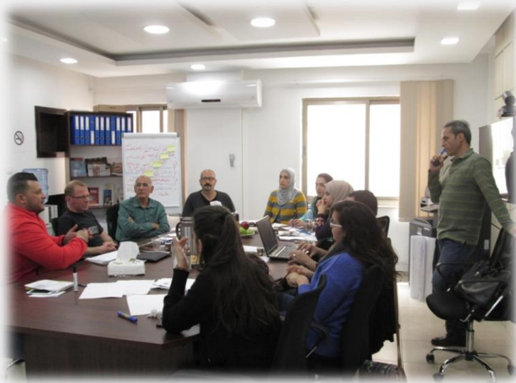
ورشة العمل الثانية – بناء استراتيجية تواصل للشبكة

← تعيين شركة "الوفا" للتدقيق الداخلي للشبكة، والهدف الرئيسي من هذا التعيين هو تقييم الإدارة الداخلية للشبكة، والمراقبة بهدف إضافة قيمة وتحسين العمليات الداخلية بالشبكة. ويساعد تعيين الرقابة الداخلية الشبكة على تحقيق