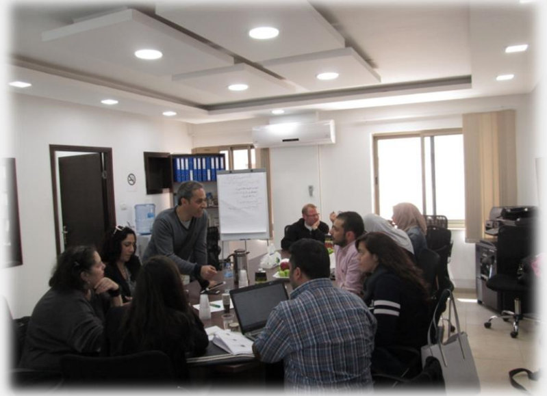
ورشة العمل الأولى – بناء استراتيجية تواصل للشبكة

4- يتم في الوقت الحالي العمل على تحضير المسودة النهائية لبناء استراتيجية تواصل للشبكة، وذلك بعد عقد ورشتي عصف ذهني مع المؤسسات الأعضاء للشبكة تم فيهما مناقشة الرسائل، وأدوات التواصل، وإجراء تحليل لنقاط القوة والضعف، والفرص المتاحة والمخاطر (SWOT Analysis) لقطاع الثقافة وتحديداً الفنون الأدائية.