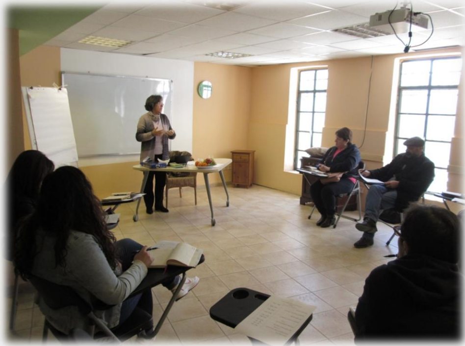
ورشة عمل منطقة الجنوب